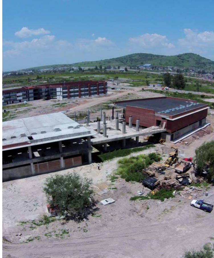
Vista aérea de la obra de construcción del Centro Universitario de Tonalá.