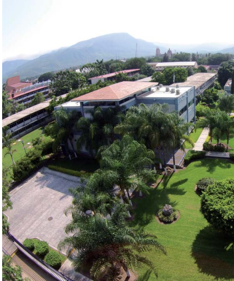
Vista aérea del Centro Universitario de la Costa Sur.