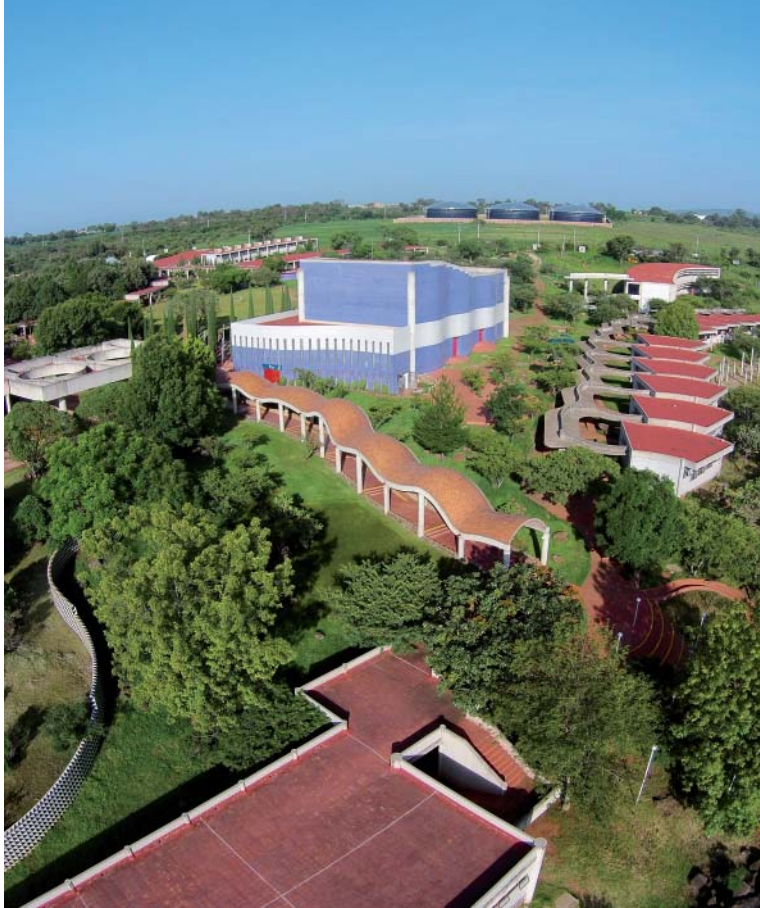
Vista aérea del Centro Universitario de los Altos.