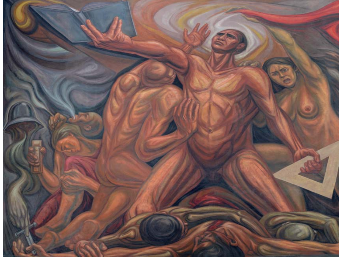
© Archivo UdeG / Mural: Universidad y educación popular (1978), Guillermo Chávez Vega. Edificio de la Preparatoria de Jalisco.

A finales de los años 80, el fin de la Guerra Fría y la caída del muro de Berlín, propiciaron múltiples cambios de escala planetaria, que dieron paso a un nuevo escenario geopolítico, en el cual adquirieron relevancia organismos multilaterales como la Organización para la Cooperación y el Desarrollo Económico, el Banco Mundial y las diferentes agencias de la Organización de las Naciones Unidas, cuyas orientaciones de política pública influyeron e influyen a todas las naciones del planeta.