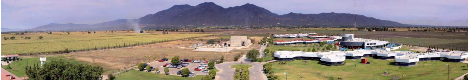
Vista panorámica del Centro Universitario de Los Valles.