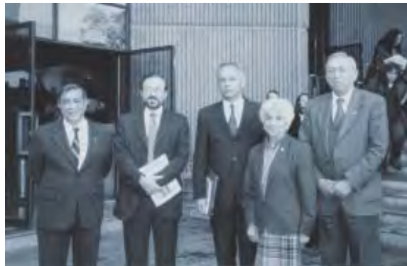
Con Profesores Eméritos de la Facultad de Medicina Veterinaria y Zootecnia de la UNAM, durante la entrega del Premio Universidad Nacional, noviembre de 2001.