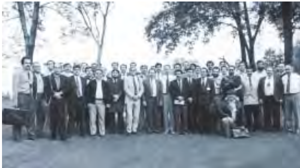
Compañeros estudiantes de la Facultad de Medicina Veterinaria y Zootecnia, 1969.