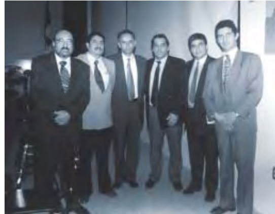
Presidentede la Federación de Colegios y Asociaciones de Médicos Veterinarios Zootecnistas de México A.C., marzo de 1996.