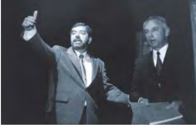
Entrega del Premio Nacional al Mérito Gremial, Federación de Colegios y Asociaciones de Médicos Veterinarios Zootecnistas de México A.C., agosto de 1998.