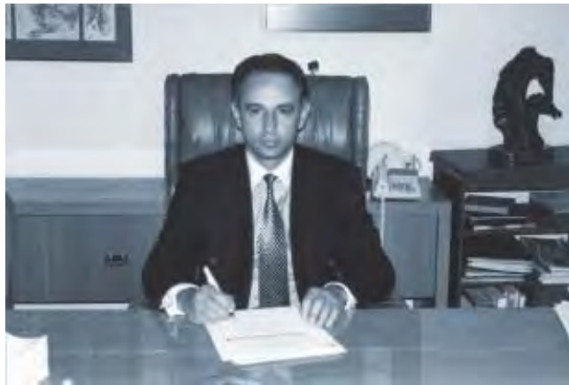
Presidente fundador del Consejo Nacional de Educación de la Medicina Veterinaria y Zootecnia, marzo de 1995.

La investigación, como ya lo mencioné, ha sido desde los inicios de su carrera una preocupación real, lo que le ha valido el reconocimiento por parte del Gobierno Federal al haber sido nombrado miembro del Sistema Nacional de Investigadores desde la fundación de éste en el año de 1984, cuando ingresa en el nivel I y, a partir de 1996 reconocido como investigador Nivel III con vigencia hasta el año 2014. El reconocimiento como investigador líder en su objeto de estudio, no se limita al ámbito nacional lo cual se demuestra en la publicación de 87 artículos en revistas indexadas de circulación internacional.