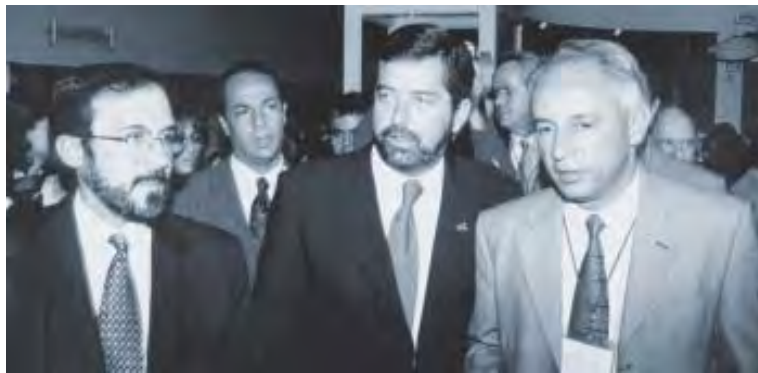
Presidente de la Asociación Panamericana de Ciencias Veterinarias, Buenos Aires, Argentina, octubre de 2004.