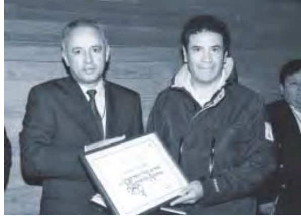
Festejos de los 150 años de Educación Veterinaria en México y América, Centro Médico Siglo XXI, agosto de 2003.