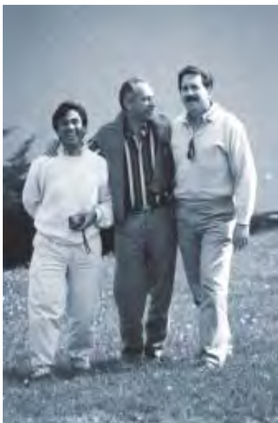
Reunión del Consejo Panamericano de Ciencias veterinarias, Salvador Bahía, Brasil, marzo de 2004.