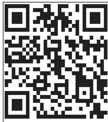
Centro de profesores Google for Education

Una de esas lecciones es que los ambientes virtuales, por mucho